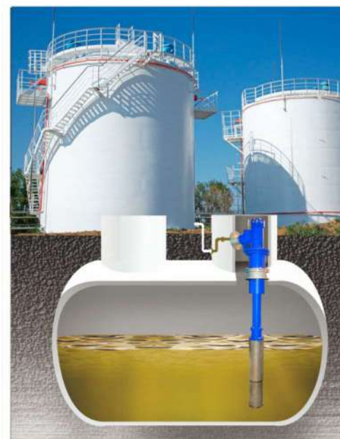
Применение электронасоса для откачивания жидкости из дренажной ёмкости