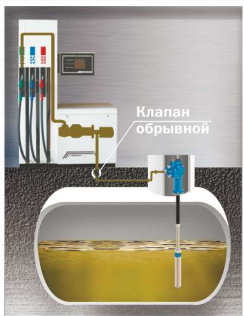
Применение электронасоса для подачи топлива к ТРК

5 При выборе электронасосов АНП для АЗС так же необходимо учитывать количество островков выдачи и выбор ТРК с необходимым количеством выдаваемых продуктов и величиной производительности по каждому каналу выдачи.