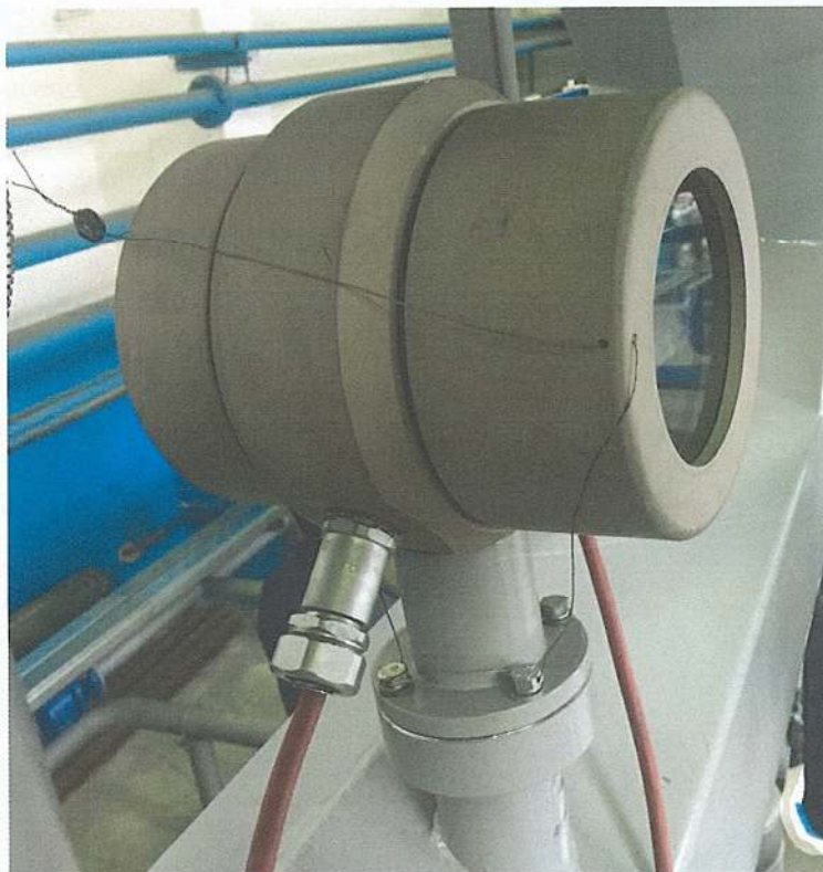
Рисунок 2 - Схема пломбировки счетчика от несанкционированного доступа.

Пломбирование счетчиков осуществляется путём нанесения знака поверки давлением на пломбу, установленную на контрольной проволоке. Место пломбирования счетчика приведено на рисунке 2.